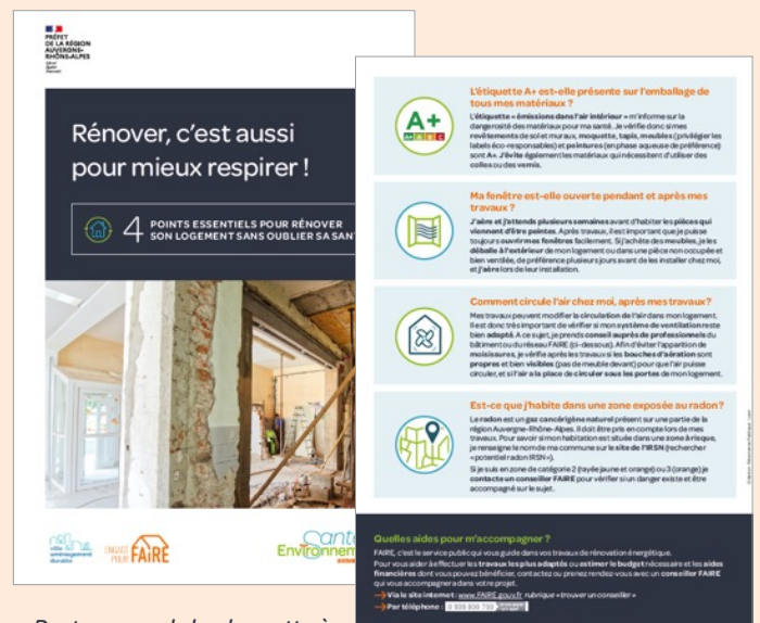
Recto-verso de la plaquette à destination du grand public et des professionnels du BTP.

Une plaquette à destination des particuliers qui engagent des travaux de rénovation de leur logement a été produite et mise à disposition des professionnels du conseil en rénovation et du grand public. Cette plaquette présente quatre bonnes pratiques à intégrer lors de la rénovation d'un logement, et les aides proposées par l'ADEME dans le cadre du dispositif de conseil à la rénovation énergétique FAIRE.