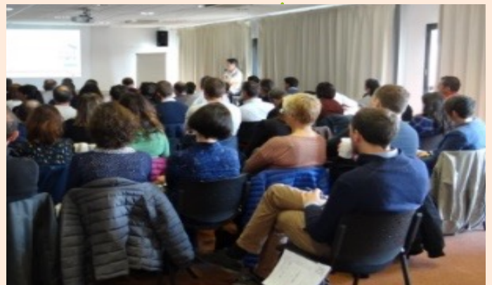
Une photo prise lors d'une journée de sensibilisation des professionnels à la qualité de l'air intérieur.

Pour inciter les acteurs locaux à mieux prendre en compte les enjeux liés à la qualité de l'air intérieur, des journées techniques ont été organisées à destination des professionnels en charge d'établissements recevant du public et des acteurs du conseil aux collectivités. Au programme figuraient une sensibilisation aux bonnes pratiques pour favoriser la qualité de l'air intérieur, la présentation d'outils de diagnostic, le retour de collectivités engagées ou encore un focus sur les risques liés au radon dans la région.